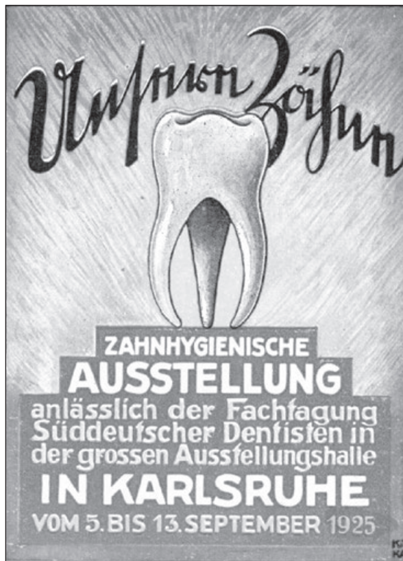
Abbildung 2: Werbeanzeige für die vom Institut für die Öffentlichkeit veranstaltete Ausstellung „Unsere Zähne“ im Jahr 1925

Um es vorwegzunehmen, wir sind fündig geworden. In der Akademie für Zahnärztliche Fortbildung Karlsruhe sind in den Beständen, im Keller und in Schränken eine Reihe von in Vergessenheit geratenen Dokumenten aufgetaucht, beispielsweise Schwarzweiß-Fotos von Referenten vergangener Tage, alte Tonband- und Videoaufnahmen, Protokolle und Fachbücher. Bereits archivierte Unterlagen, das digitale, die Wissenschaft der Akademie umfassende Hauer-Archiv und das umfangreiche Bildarchiv der Zahnärztlichen Akademie wurden gesichtet (s. Abbildung 2).