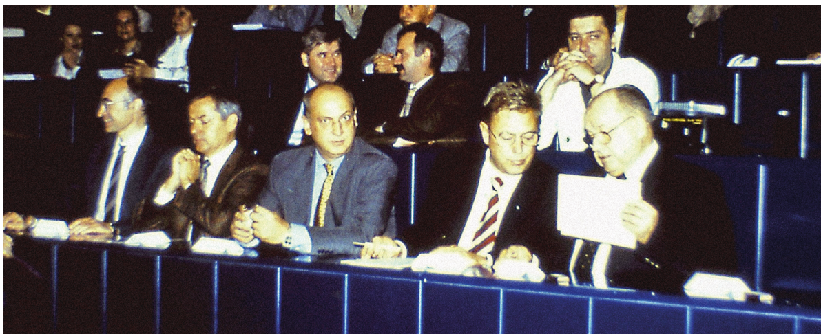
Neuer Hörsaal. Mit Hilfe der finanziellen Unterstützung durch die griechische Regierung konnte der Hörsaal wieder aufgebaut werden.