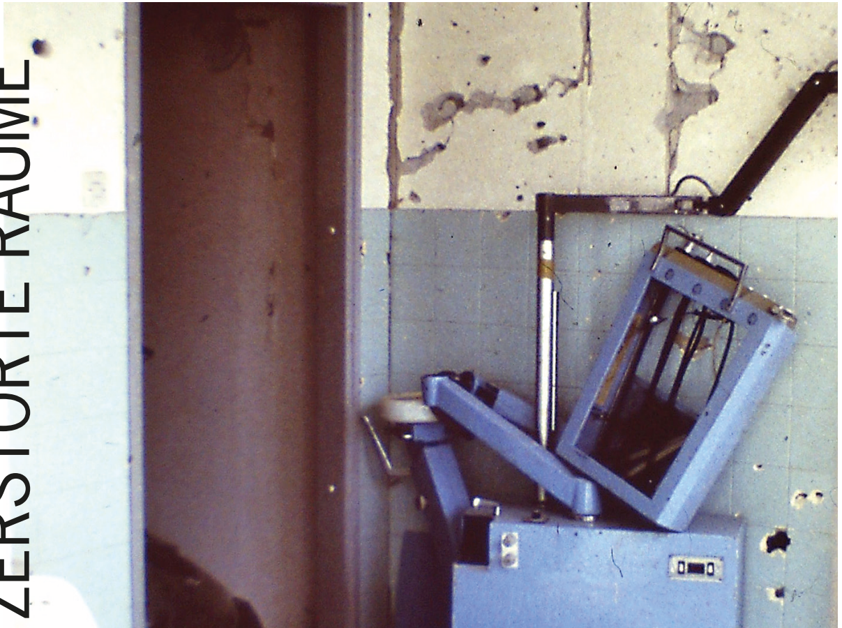
Zahnklinik. Verwüstete Behandlungs- und Schulungsräume prägen das Bild.