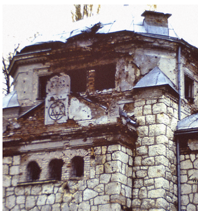
Zerstörte Synagoge in Sarajevo.