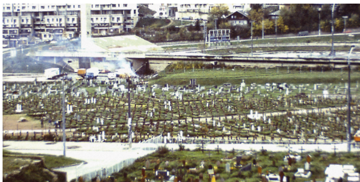
Stumme Zeugen der Kriegsgreuel.